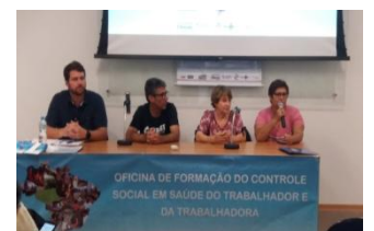
Capacitação em Saúde do Trabalhador para o Controle Social