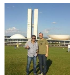
Congresso ANAMT Brasília - Saúde do Trabalhador na Atenção Primária