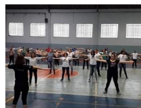
Dia Mundial de Combate a LER/DORT

Eventos: Dia Mundial de Combate a LER/DORT, Dia Mundial em Memória das Vítimas de Acidentes e Doenças do Trabalho, Capacitação do Controle Social, Comemoração dos 15 anos do CEREST de Rio Claro, Saúde no Campus - UNESP, Congresso ANAMT - Brasília, Fórum Acidentes do Trabalho - São Paulo e SIPAT - Itirapina.